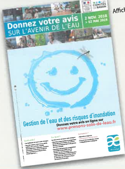
Affiche 40 x60