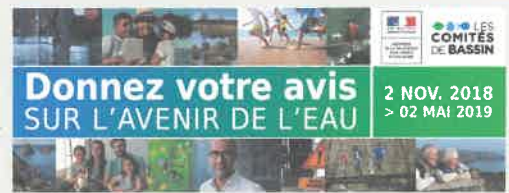
Bannières web, articles types... Besoin d'outils : sdage@eau-loire-bretagne.fr